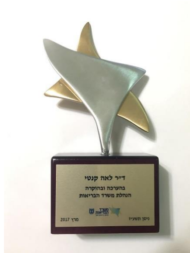
ד"ר לאה קנטי