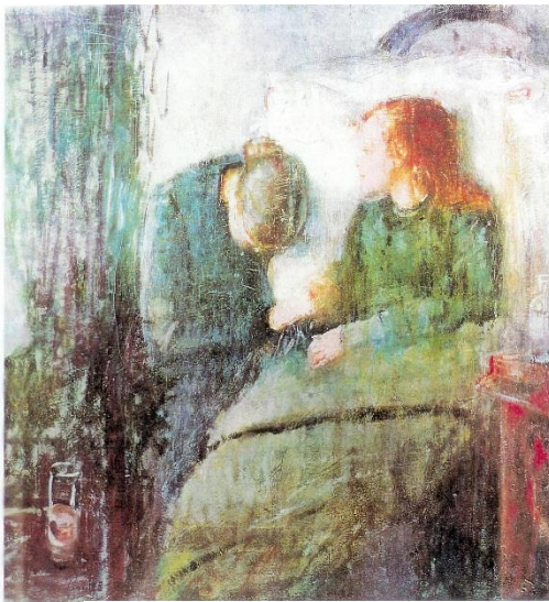
מוק - "דמויות"

במשפחות רבות, ההורים דאגו, שהסבים והנכדים יחלקו חוויות נעימות ולכן וויסו את מינון הזיכרונות הקשים. כתוצאה מכך, מרבית הנכדים לא חשו במתח שבו גדלו הוריהם והיו פנויים ליצור קשר פתוח יותר עם סביהם. השיחות עם סביהם אפשרו לנכדים להכיר את ההיסטוריה המשפחתית, שפעמים רבות הייתה מעורפלת. כך, נושאים שלא דוברו בעבר נפתחו לשיחה, לפעמים אף בפעם הראשונה מאז הטראומה. בחלק מהמקרים, העניין של הנכדים בעברם של הסבים שבר את חומת השתיקה במשפחה. במקרים אחרים, ניצולים, שנהגו לתקשר באופן פולשני ומציף, מצאו אפשרות לספר את סיפורם לנכדיהם בצורה טעונה פחות, לעבדו מחדש ולדאוג שקולם יישמע גם בדורות הבאים.