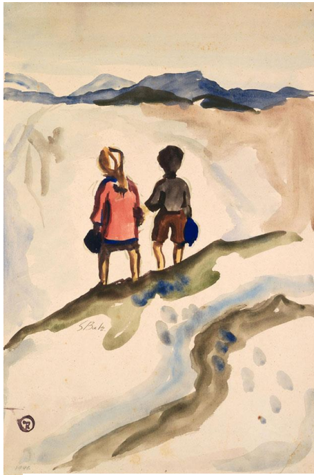
ילדים לבדם/שמואל בק

חיבור לביטאון אפריל 2017 עמותת יש: ילדים ויתומים ניצולי שואה בישראל