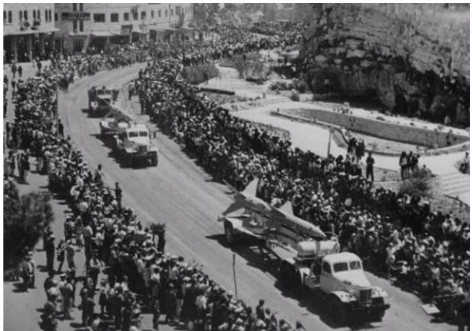
מצעד צה"ל הראשון

27.7.48 – רק שלוש שנים ושלושה חודשים חלפו, ואני צועד בראש מורם במצעד צה"ל הראשון, בנעליים צבאיות איתנות אני צועד בסך, שורות גאות וזקופות של חיילים לצדי. אני צועד תחת דגל ישראל. אין גבול לאושרי.