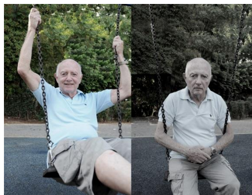
עיצוב: שרון ציוני