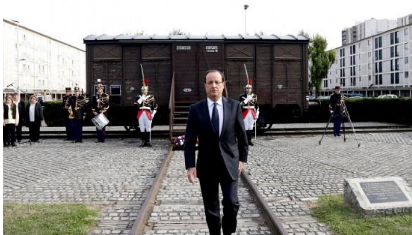
נשיא צרפת הולנד, על מסילת הרכבת סמוך לפאריס

70 שנה אחרי שחברת הרכבות הצרפתית הובילה עשרות אלפי יהודים למחנות ההשמדה, צרפת תפצה נפגעים ב-60 מיליון דולר