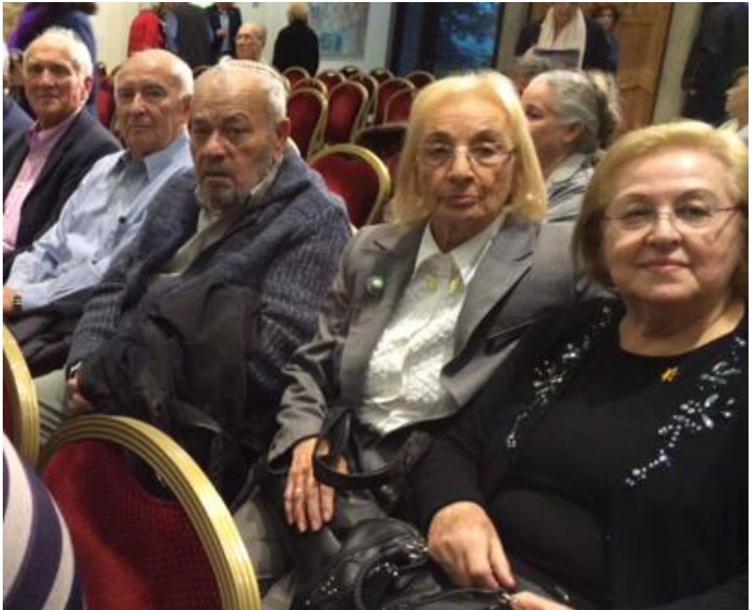
ניצולים בבית הנשיא, נר שביעי של חנוכה.

עצים. הדואג לדורות - מחנך אנשים'. בדור שלכם נתקיימו שלושתם. זרעתם. נטעתם. חינכתם. כשאתם נושאים את לפידו של הדור הזה, אתם נושאים אתכם אחריות גדולה. זהו לפיד של אור, של גבורה, של בחירה בחיים ושל דרך."