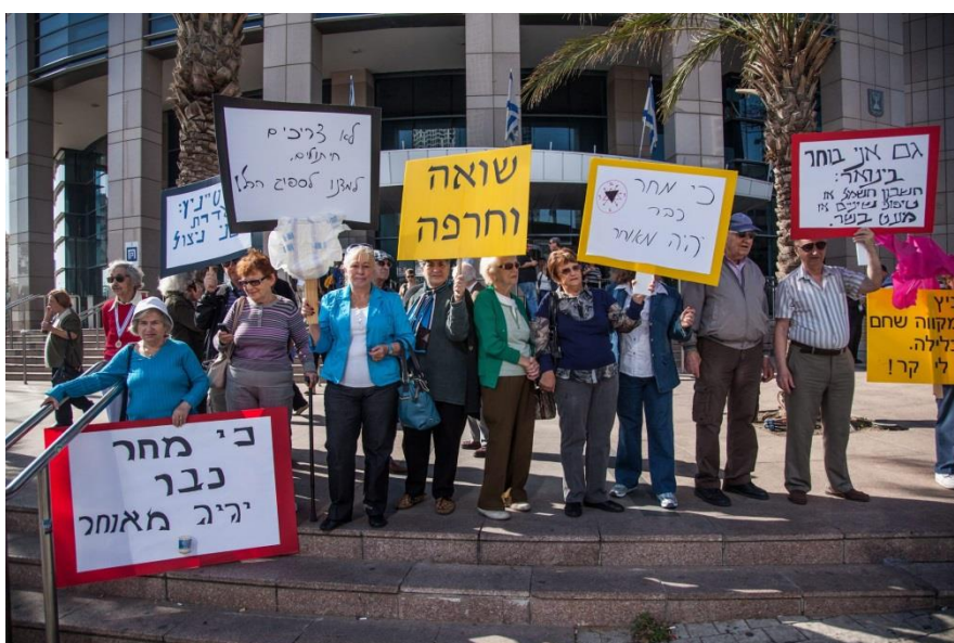
הפגנת ניצולי שואה בתל אביב 2012

בישראל נמצאות קרקעות רבות ששייכות לנספי השואה ולמשפחותיהם. חלק מהמשפחות והקרובים נספו אף הם. קרקעות אלו לא שייכות למדינה, שבפועל הפקיעה אותן בגסות, או הכניסה אותן תחת ההגדרה של "נכסי נפקדים", שלצערנו נרצחו בשואה. הכסף מקרקעות אלה חייב להגיע לידי הניצולים שעדיין בחיים, ולא לעבור לפקידי ממשלה טרחניים, עורכי דין ומתווכים שעסוקים בבירוקרטיה.