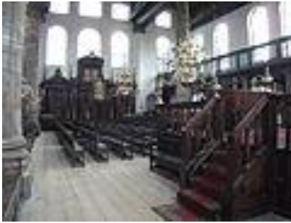
בית הכנסת הספרדי באמסטרדם, מאז 1675 ללא שינוי!