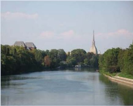
מראה העיר מגשר איזבלה, ברקע בולט בניין Mole Antonelliana שיועד במקורו להיות בית הכנסת של הקהילה היהודית

מאת: ג'ורג'יו דה ג'ורג'י ניצול שואה - מאיטליה