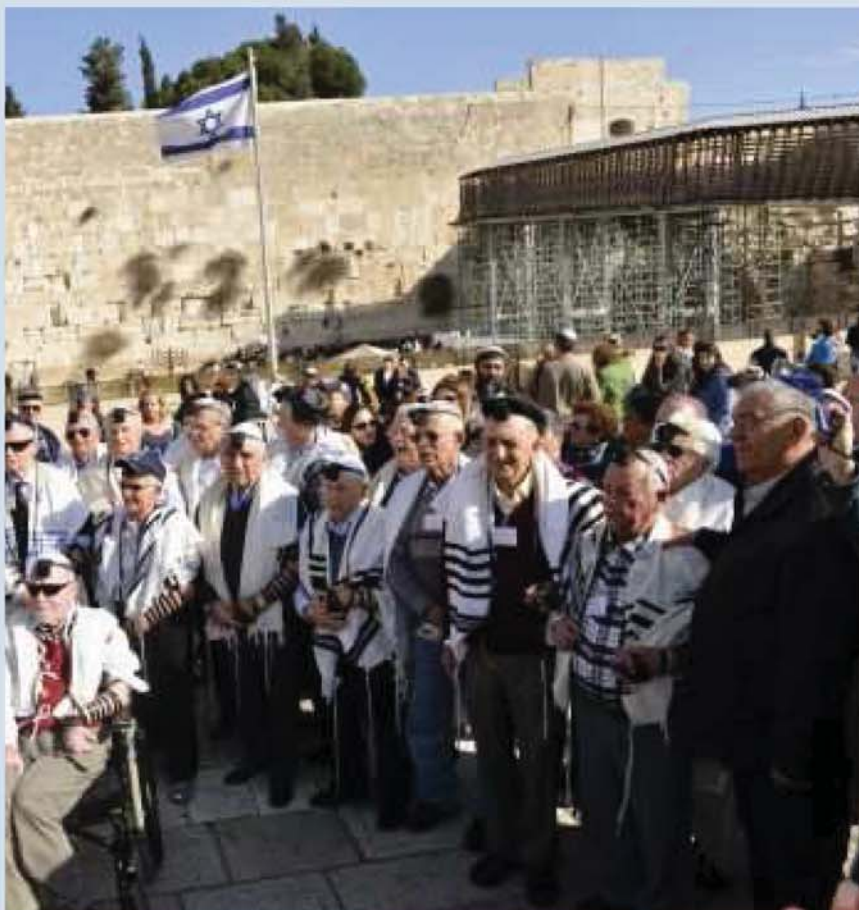
בר מצווה לניצולי השואה בכותל

מאתנו נלחמו נגד האוייבים שפלשו מארצות ערב. רק בתום המלחמה הגשמו את חלומנו והגענו הביתה. על פי מילותיו של הנביא יחזקאל, העצמות היבשות קרמו עור וגידים והפכו לעובדה לנגד עינינו. קמנו לתחיה שוב בארץ ישראל. אספנו את כוחות הנפש, קמנו על הרגליים ויחד תרמנו לפיתוח הארץ וקידומה. ביום מיוחד זה, אנחנו סוגרים מעגל. האירוע המרגש בא כפיצוי על הפסד הנעורים. אמנם אנחנו מבוגרים בשנים רבות, אבל הגיע תורנו לחוג את האירוע היהודי החשוב בחיי נער יהודי ועל כך אנו מודים לכל הטורחים ועושים במלאכה ומברכים "ברוך אתה אלוהינו מלך העולם שהחיינו וקיימנו והגענו לזמן הזה".