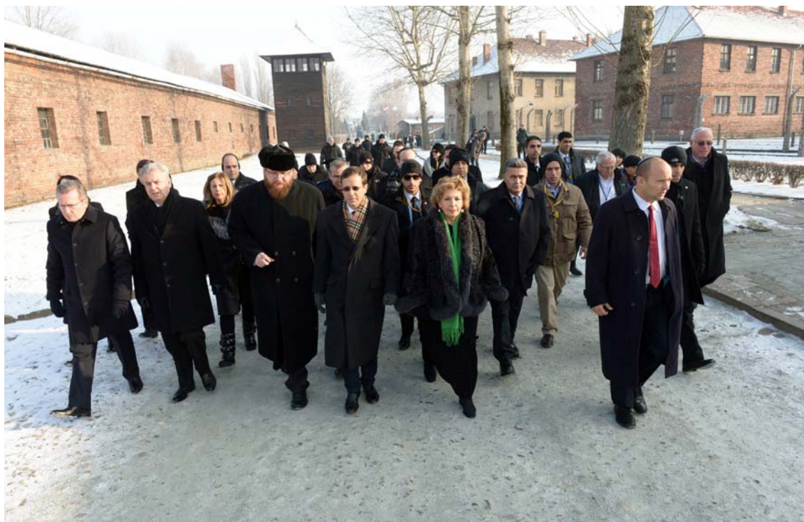
משלחת הכנסת באושוויץ, ינואר 2014