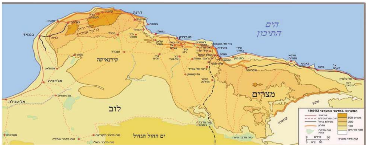
השואה של יהודי צפון אפריקה

מזיכרוני כילדה, בערך בתחילת שנת 1945, עברנו לפתע הורי, אחותי הקטנה ואני, לגור אצל סבתי. פתאום גיליתי בביתה חדר חשוך, עם קורות עץ ותקרת עץ. כששאלתי למה קורות עץ, אמרו לי שזה מקלט. יש מלחמה וזו ההגנה שלנו. לא ידענו מה זו מלחמה. החדר זימן מקום נפלא למשחקי מחבואים ותופסת, ואנו שמחנו בו. ביתה של סבתי היה ברובע היהודי, שהפך לגטו סגור בלילות, על פי צו הממשל. ביום תפסו את הגברים שנשלחו למחנות עבודה. אנשים נעלמו. בלילות היה עוצר, רק חיילים הסתובבו ברחובות. החיילים חיפשו נשים ויין. על מנת להגן על עצמנו, כולם חזרו הביתה מוקדם. סגרו היטב את הבית ושמו ארונית כבדה ליד הדלת כדי שלא ניתן יהיה לפתוח מבחוץ, מאיתנו הילדים ביקשו שנשמור על השקט. ערב אחד, שמענו דפיקות חזקות על הדלת. כולם פחדו. עוד רגע והדלת נפרצת. הכניסו את כולנו למקלט. הגברים שבחבורה יצאו לשאול מה קרה ואת מי מחפשים. החיילים ענו בשפה גסה של שיכורים: "רוצים נשים ויין! פתחו את הדלת!". אבי ודודי גייסו את כל האנרגיות הטובות שלהם, הוציאו להם החוצה יין, קוניאק וערק. התחילו לשוחח איתם ולהשקות אותם, כוס אחר כוס, עד שהחיילים היו שיכורים כלוט ונפלו על הקרקע. מיד