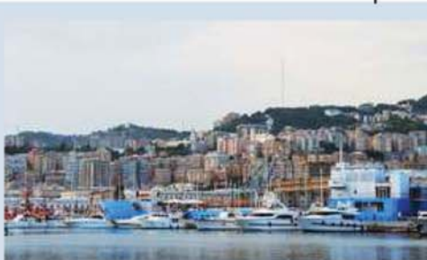
הנמל בג'נובה (גנואה)

אימי שהייתה בהריון בחודש תשיעי, התעקשה לחזור לבית בטורינו וללדת בעזרת מיילדת, כפי שילדה ארבע לידות קודמות, בלי לחשוב על הסכנה. אחרי הלידה התפתחה לאמא טרומבזה קשה ברגל. הרופא שטיפל בה אמר שאסור להזיז אותה מהמיטה כי זה עלול לסכן את חייה. ב 19.11.1943 מספר ימים אחרי שנולדה אחותי הצעירה, הוכרז סגר על היהודים וברדיו פורסם שכל היהודים ילקחו למחנות ריכוז. בלית ברירה, ברחנו עם מעט הדברים שהיו לנו עבור התינוקת. כולנו סחבנו את אמא על הידיים. עזבנו את כל הרכוש, ויצאנו בדיוק בזמן. אחרי כמה דקות, כשהיינו בשדירה ליד הבית, נעצרה משאית של ג.ו.ו. גרמני ואיטלקי, עמוסה ביהודים בשרשראות, שבא לקחת גם אותנו. אבא העמיס אותנו על שתי מרכבות ונסענו לתחנת הרכבת, בלי לדעת לאן לברוח. אבא החליט שנרד בעיר ג'נובה (Genova) ונתחבא במנהרות של הרכבות. וכך היה, כשאנו יושבים בתוך רטיבות רבה ומים שנזלו מהקירות. אבא אילתר ברזנט עם שמיכות, סמרטוטים ועיתונים. היתה בעיה רצינית עם התינוקת, ואמא היתה עם חום גבוה, ללא טיפול. אחיותי הגדולות טיפלו באמא ובתינוקת.